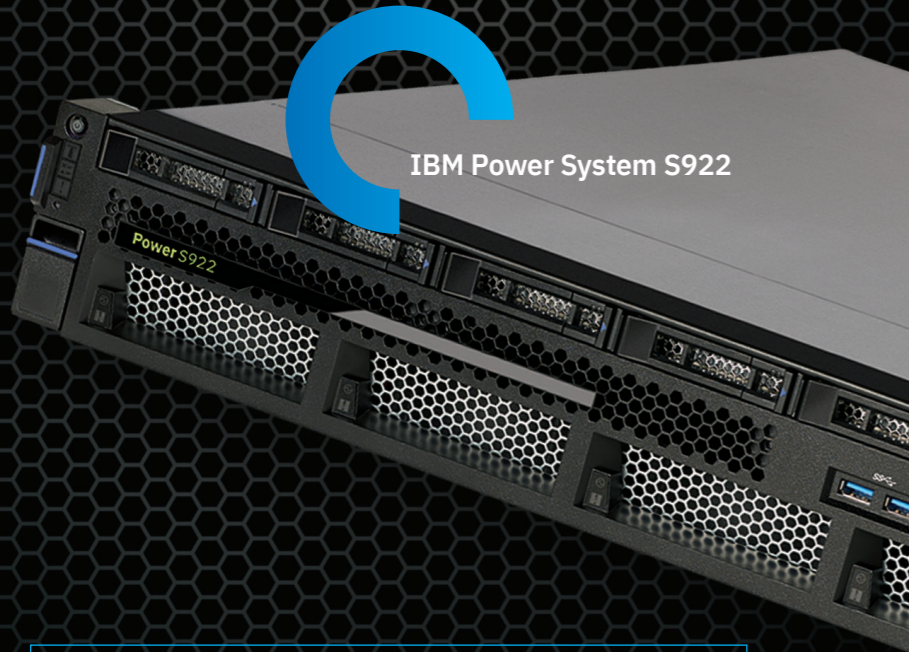
IBM Power System S922