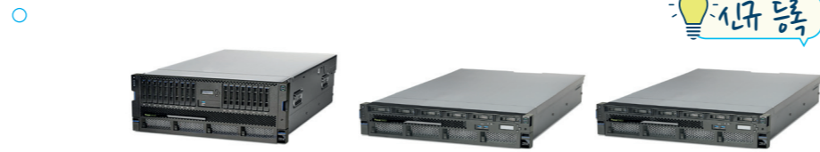
IBM Power System S914 IBM Power System S922 IBM Power System S922